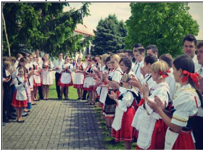
Staročeské Máje Jestřabi Lhota 2014

Staročeské Máje proběhly letošního roku 10. května přesně od 13:00 hodin. Vše začalo průvodem od kulturního domu k památníku padlých. Paní starostka u něj pronesla pár slov a zahájila májový průvod.