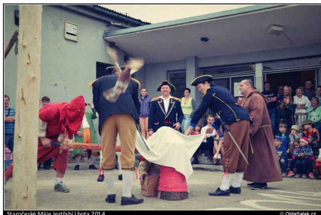
Staročeské Máje Jestřabi Lhota 2014

Po besedě přišla na řadu poprava krále, která byla plná hereckého umění. Díky katovi byla i napínavá, neboť si během průvodu opatřil skutečnou sekvru.