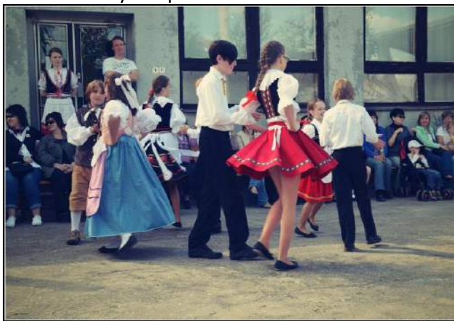
Staročeské Máje Jestřabi Lhota 2014

Máje zaznamenaly několik změn. Ty byly hodnoceny vesměs pozitivně. První změnou byla trasa, která vedla nejprve k paní starostce a poté směrem ke hřbitovu. Dále se humny navázalo na již tradiční trasu. Další změnou se stala „malá“ beseda, kterou o pauze zatančili tanečníci do 15 let. Tito se tak poprvé dostali do středu zájmu diváků i ostatních tanečníků, neboť se pozornost upřela jen na jejich dvě kola. To bylo patrné na jejich nervozitě, která se však nijak nepromítla do samotného vystoupení.