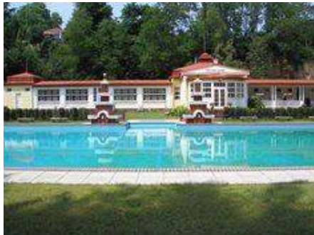
Koupaliště Mšeno u Mělníka